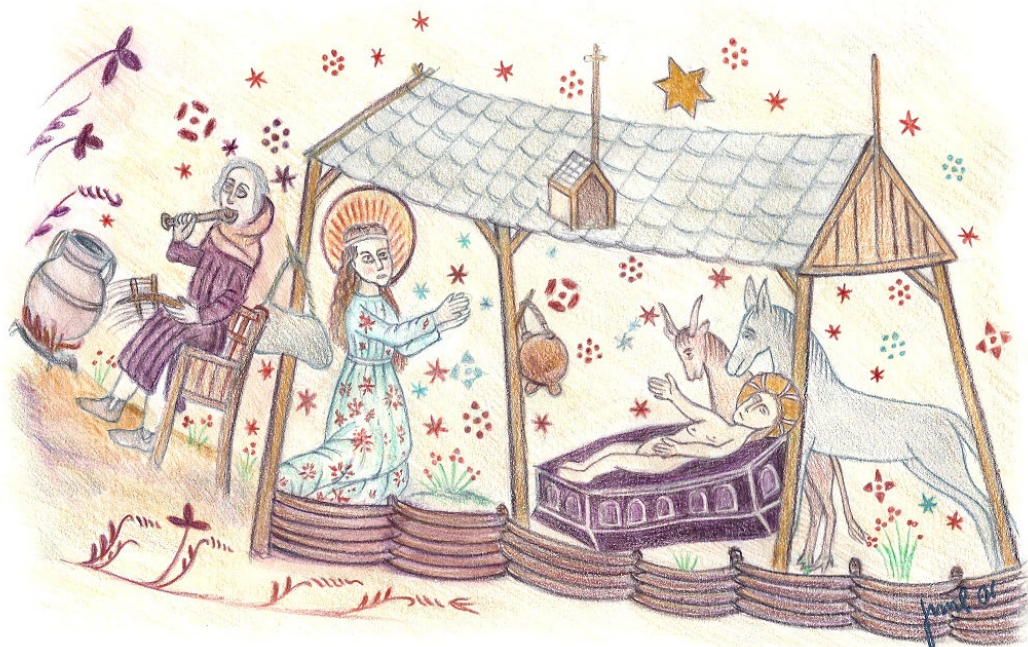
Tegning: Poul Juul