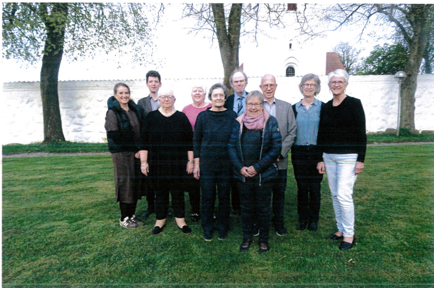
Vejlby Sogns menighedsråd